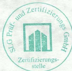
U. Schult Zertifizierungsstelle

This certificate is the result of tests carried out on one sample and does not represent the serial production of this product.